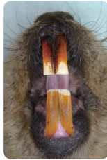
アメリカビーバーの歯

げっ歯目（ネズミ目）は現生哺乳類の中ではもっとも種類が多く約4割を占め、南極大陸とニュージーランド以外の世界中に分布しています。常に固い物（エサ）をかじっていますので、上下一対の門歯は絶えず伸び続けます。プレーリードッグは群れで生活し、イネ科の植物を好んで食べます。