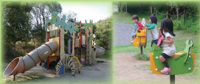
滑り台や木馬などの幼児向けの遊具もあります