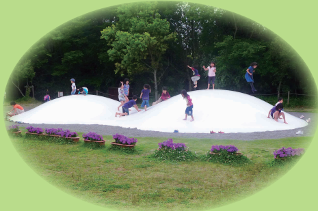
大人気の「ふわふわドーム」(小学生以下のお子様対象)