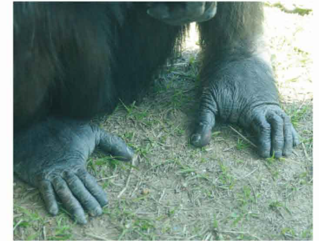
【チンパンジーの足】

親指がほかの指と離れているため、ものをつかみやすくなっています。歩くときは、地面に足の裏全体をつけて歩きます。