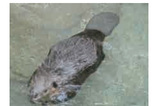
アメリカビーバー

アメリカビーバーはネズミの なかまで木の皮や葉を食べます。 カワウソはイタチのなかまで _____を食べます。