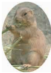
プレーリードッグ