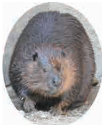
アメリカビーバー